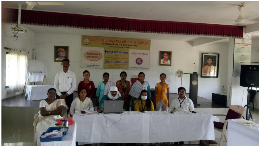
Health Check up Camp