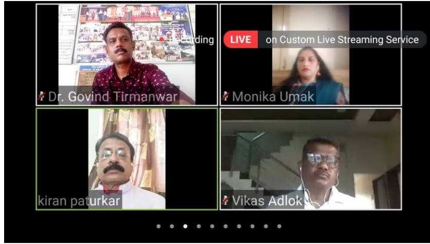
Workshop on 'Udyojak Hou Ya'