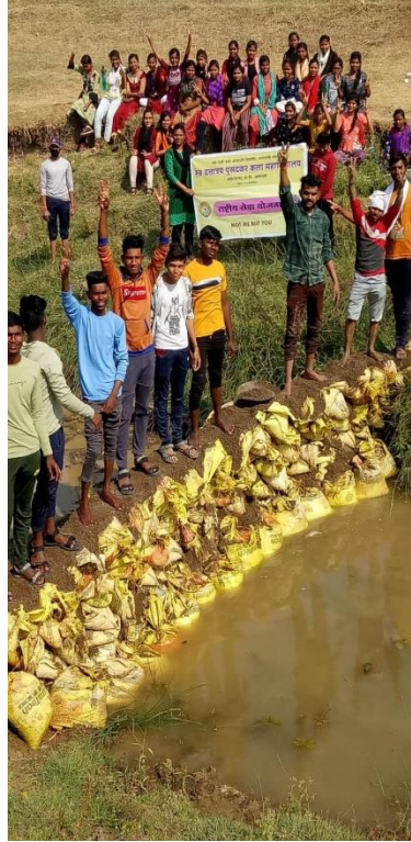
Water Conservation in Special Camp at Nandura Lashkarpur