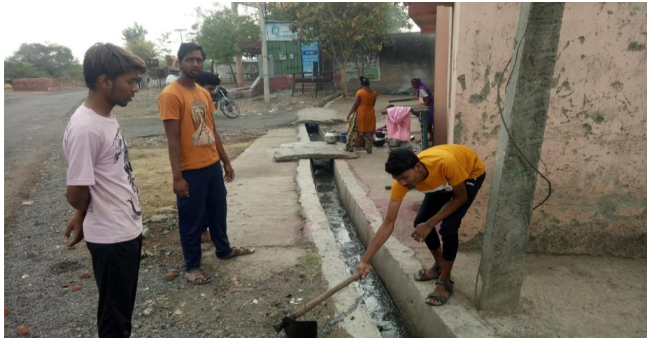
Village Cleanliness Drive in Special Camp