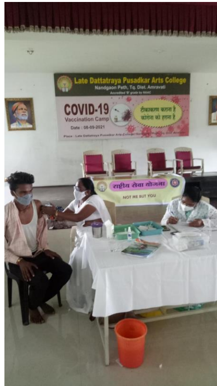
Covid-19 Vaccination Camp