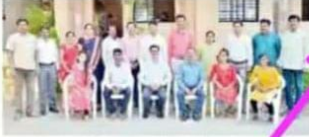
गुणवत्ता यादीत आलेल्या विद्यार्थ्यांसह शिक्षक वृंद